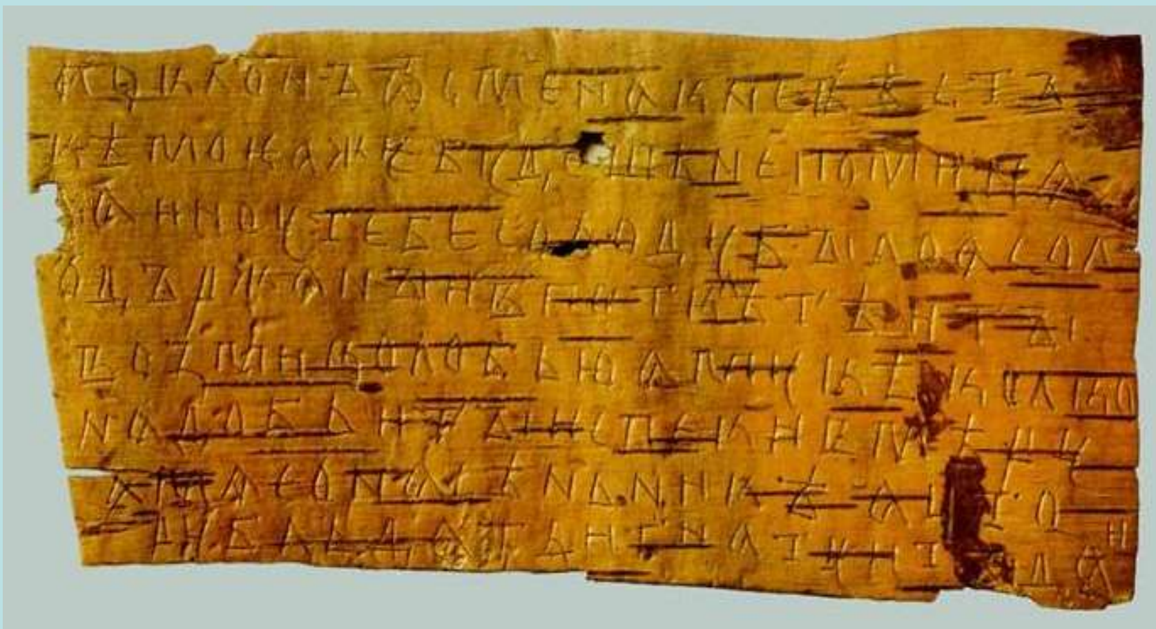
Грамота №363. Конец XIV в. Письма Семёна своей невестке с хозяйственными распоряжениями. Размер 16,4*8 см.